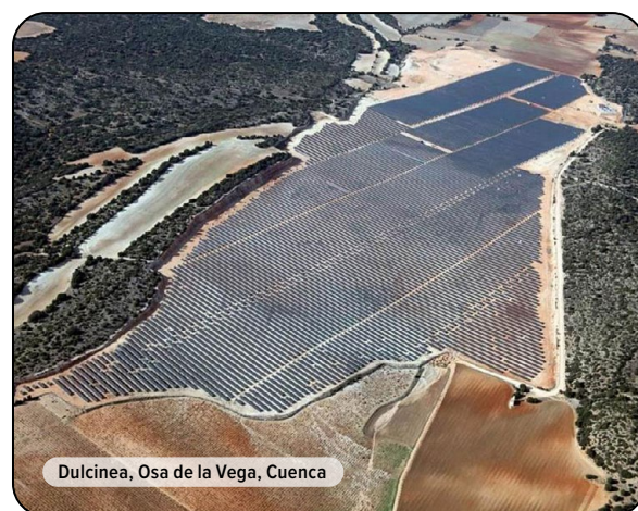
Dulcinea, Osa de la Vega, Cuenca

Autres couleurs sur demande et sous réserve d'un minimum de fabrication.