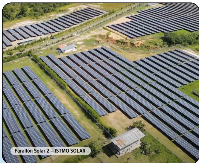
Farallón Solar 2 – ISTMO SOLAR